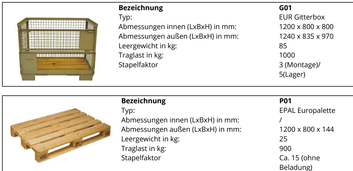
Abbildung 1 KRONE-Standardladungsträger

Als KRONE-Standardladungsträger gelten die folgenden Ladungsträger: