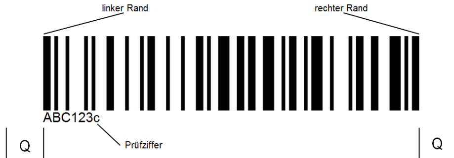
Abbildung 4 Abstände zum Barcode

Der Abstand von Beginn/Ende des Barcodefeldes zu Rändern, anderen Strichen oder Zeichen (= „Quiet-Zone“) sollte mindestens 6,5 mm betragen.