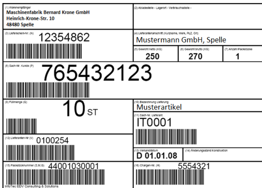
Abbildung 3 VDA-Barcode-Empfehlung

Als Warenanhänger kann die Vorlage der VDA-Empfehlung 4902 – Warenanhänger (Barcodefähig) Version 4.0 gewählt werden. Abweichend hiervon ist für die Barcodes jedoch eine Codierung nach Code 128 zu verwenden.